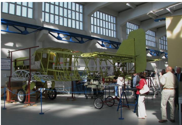
Technikmuseum HUGO JUNKERS Dessau