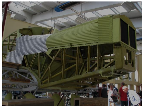
JUNKERS F.13 ( Nachbau Stand 2010 )

Hugo Junkers war ein exzellenter und sehr kreativer Ingenieur. Fällt sein Name, denkt man unwillkürlich an Gasthermen und Flugzeuge.