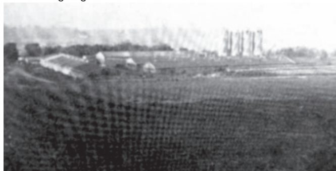
Gesamtansicht der JRA (Jungrinderaufzucht) in Seiffen