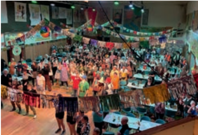
Hummel-Hummel-Helau! Euer Cämmerswalder Carnevalsclub

Ein herzliches Dankeschön an alle treuen & neuen Faschingsgäste, an alle Mitwirkende, die zum Gelingen der Veranstaltungen beitragen - vor und hinter den Kulissen, an alle Helfer materieller und finanzieller Art, an alle Helfer bei der Speise- und Getränkeversorgung!