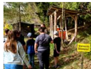
Exkursion der 6. Klassen ins Bienenreich