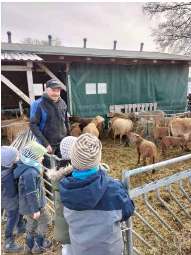
Text und Foto: Jana Neuber

Bis zum nächsten Jahr zur Lammzeit in Dittersbach!