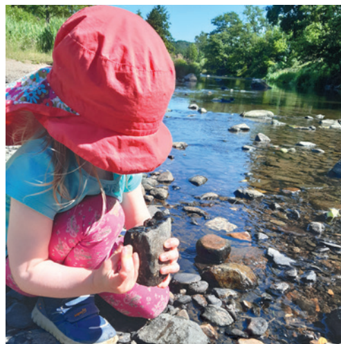
Foto: Bei einem genauen Blick ins Gewässer, kann man Vieles entdecken.

Dieser Text entstand in Zusammenarbeit der Fachberaterinnen und Fachberater Gewässer des Landesamtes für Umwelt, Landwirtschaft und Geologie und der unteren Wasserbehörde des Landkreises.