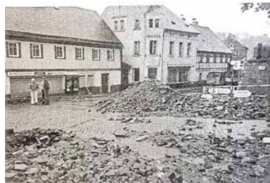
Beginn der Beräumung im Kreuzungsbereich