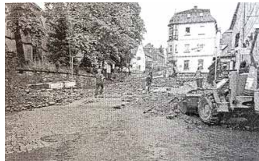
Räumungsarbeiten im Bereich Brüxer Straße