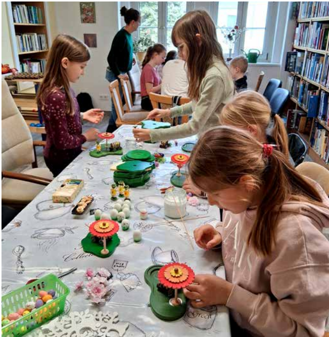
Text und Foto: Jana Neuber

Auf den nächsten Bastelnachmittag freut sich das Team der Bibliothek Neuhausen!