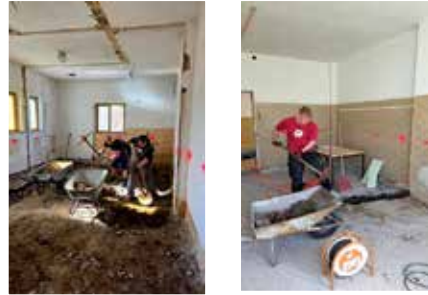
Bilder Abriss Turnhallen Toiletten 04/05 2026

Das Projekt lebt vom Engagement der Menschen hier in Neuhausen – danke an euch alle.