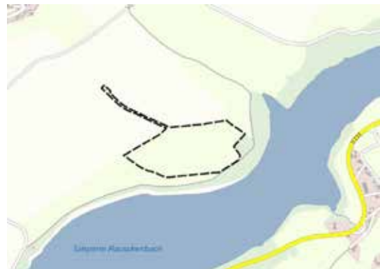
Abbildung 1: Geltungsbereich des Bebauungsplanes

Der Beschluss ist ortsüblich bekannt zu machen. Eine einzelfallbezogene längere Frist nach § 3 Abs. 2 Satz 1, Halbsatz 4 BauGB ist nicht geboten, da kein besonders komplexes Planvorhaben vorliegt. Das Planvorhaben beschränkt sich zu überwiegenderen Teilen auf flächige Festsetzungen von sonstigen Sondergebieten und Flächen oder Maßnahmen zum Schutz, zur Pflege und zur Entwicklung von Boden, Natur und Landschaft.