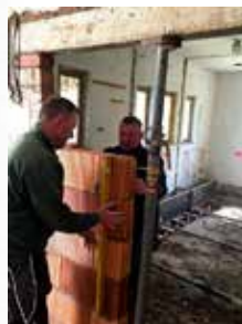
Maurerarbeiten am 13.06.2026

Kurz darauf folgte eine weitere Aktion: Mit vielen fleißigen Händen wurde der Boden mit Frostschutzmaterial vorbereitet. Dadurch konnten die notwendigen Rohrleitungen verlegt und anschließend weitere 2 m³ Beton für eine stabile Bodenplatte gegossen werden.