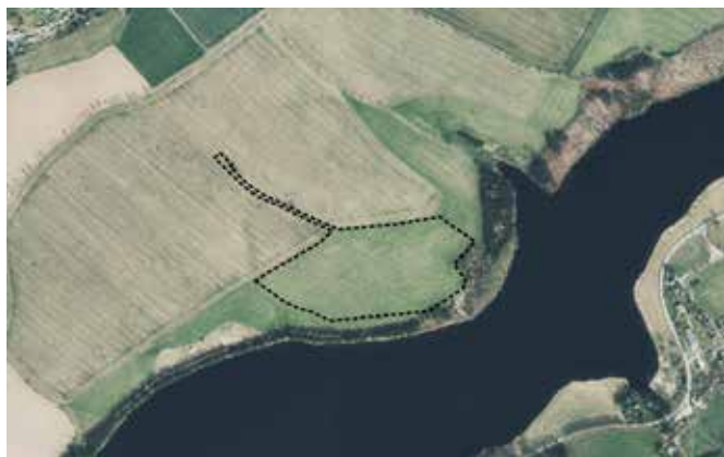
Abbildung 1: Geltungsbereich des vorhabenbez. Bebauungsplanes