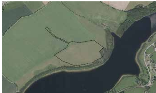
Abbildung 2: Geltungsbereich der 2. Flächennutzungsplanänderung