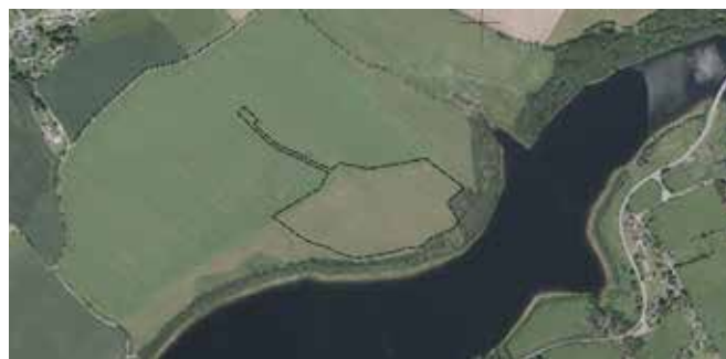
Abbildung 1: Geltungsbereich der 2. Änderung des Flächennutzungsplanes der Gemeinde Neuhausen/ Erzgeb.

Der Beschluss ist ortsüblich bekannt zu machen. Eine einzelfallbezogene längere Frist nach § 3 Abs. 2 Satz 1, Halbsatz 4 BauGB ist nicht geboten, da kein besonders komplexes Planvorhaben vorliegt. Das Planvorhaben beschränkt sich zu überwiegenden Teilen auf flächige Festsetzungen von sonstigen Sondergebieten